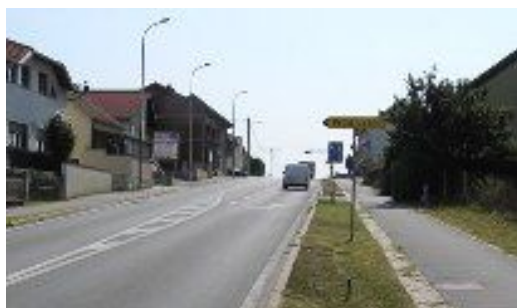
Putokaz: Prokljivani lijevo

Iz Bjelovara pratite putokaze za Daruvar, nakon prodajnog centra Lidl pređete most i uspinjete se na uzvisinu na čijem vrhu je semafor. Prije semafora skrećete lijevo (postoji i putokaz za PROKLJUVANE!) i Novoseljanskom ulicom vozite ravno do natjecateljskog centra.