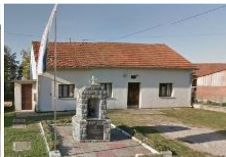
Dom Prokljivani 53